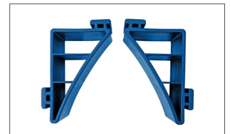
Haltehörner 1722H Für runde Güter