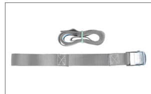
Zurrurt 1722G 100 mm lang mit Gurtklemme